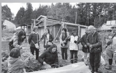
きのこの収穫や伐採のワークショップ