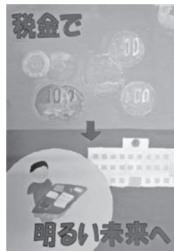
▶一般財団法人飯田法人会阿南売木支部長賞 荻原 健正 (小5)