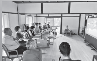
映像制作についてのワークショップ