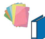
ファイル (金属部分は 取り除く)