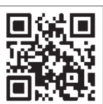
マイナポータル QRコード