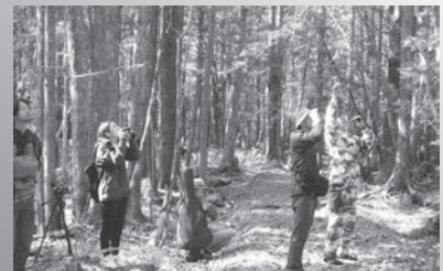
アテビ平小鳥の森でのガイドウォーク