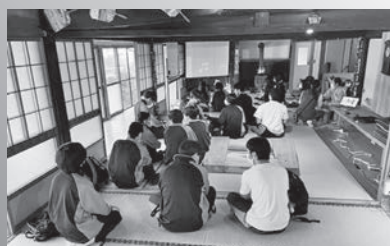
集落支援員による英語デイキャンプ