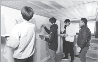
うるぎ国際センターでの漆喰塗り体験