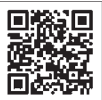
ねんきんネット QRコード