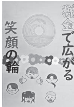
▶飯田税務署長賞 松村 紗希 (小6)