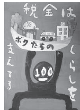
▶売木村教育委員会賞 清水 虹太郎 (小6)