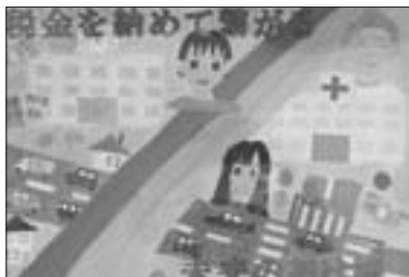
売木村租税教育推進協議会長賞 永瀬 芳 (小6)