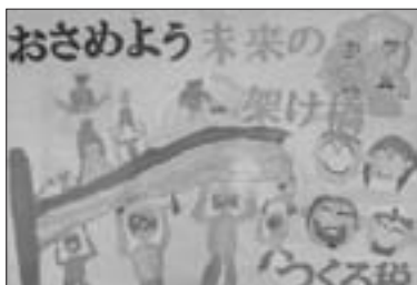
(社)飯田法人会阿南売木支部長賞 井原 勇樹 (小5)