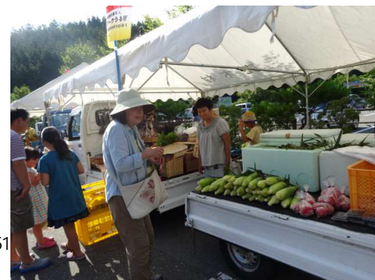
※2013年高原朝市の様子

- うるぎ高原朝市実行委員会 - 問い合わせ先 : 売木村観光協会 〒399-1601 長野県下伊那郡 売木村543-1うるぎふるさと館内 TEL : 0260-28-2000 FAX : 0260-28-1051 E-mail : kankokyokai130531@gmail.com URL : http://www.urugi.jp/